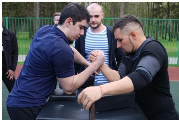
Фестиваль «Новая весна»

июнь – соревнования по настольному теннису от 16 лет.