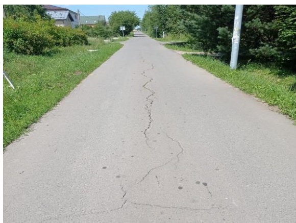
фото - до ремонта