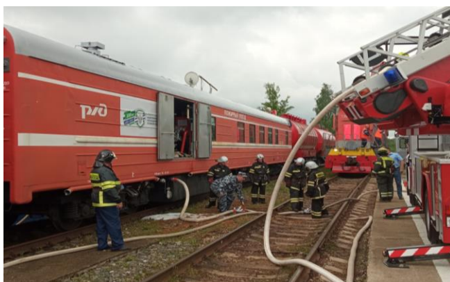
Тактико-специальные учения на ст.Бекасово-Сортировочное

- 18 августа в командно-штабном учении по теме: «Действие органов управления, сил и средств МГСЧС по отработке вопросов ликвидации чрезвычайных ситуаций, возникающих в результате природных пожаров, защиты населенных пунктов, объектов экономики и социальной инфраструктуры от природных пожаров».