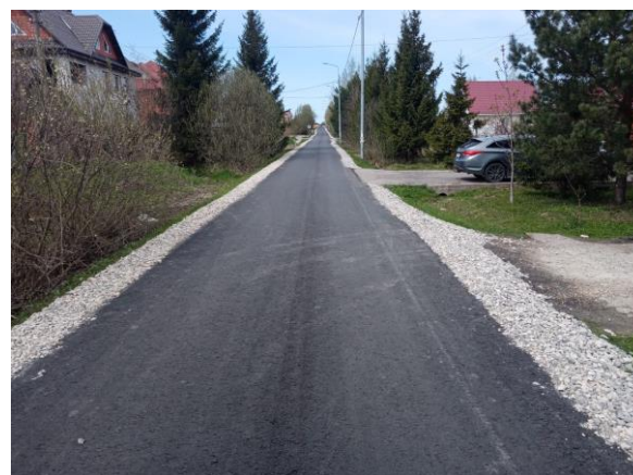
фото - после ремонта