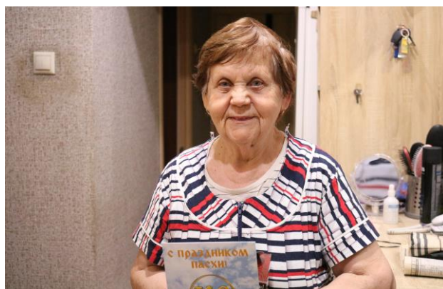
Акция «Пасхальный дар»

В декабре 2022 года администрация поселения Киевский совместно с Советом ветеранов поздравили 22 одиноко проживающих жителя поселения с новогодними праздниками и вручили праздничные наборы.