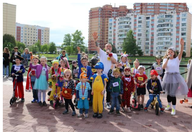
День защиты детей