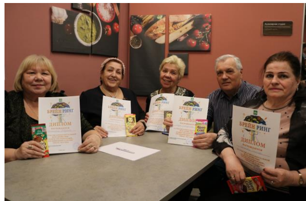
Брейн-ринг «Равенство поколений»

июнь - соревнования по настольному теннису в рамках месячника борьбы с наркоманией, в соревнованиях приняли участие более 15 человек, а также запустили видеоролик «Скажи, нет наркотикам!».