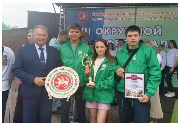
VII окружной Фестиваль народов России

Провели 3 турнира по Киберспорту, в которых приняли участие 45 человек.