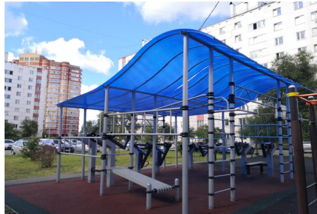
Атлетический павильон у жилого дома № 10 р.п.Киевский

7) р.п. Киевский, дом № 10,15,17,20: выполнена замена песочницы и дооснащение каруселью на детской площадке у дома № 15, на спортивной площадке у дома № 10 установлен атлетический павильон, проведена замена резинового покрытия;