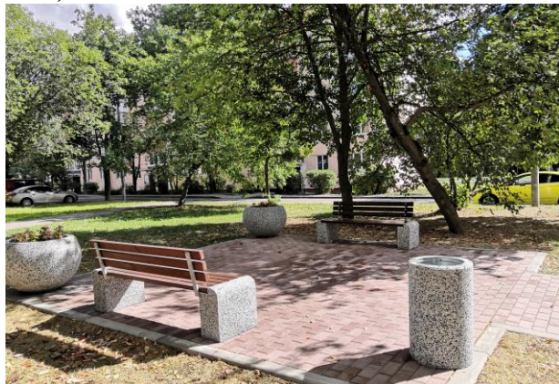
Площадка тихого отдыха у жилого дома № 5 р.п.Киевский

6) р.п. Киевский, дом № 4,5,16: выполнено устройство площадки тихого отдыха с установкой парковых диванов, урн, вазонов, устройство газона у дома № 5;