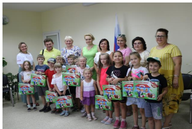
Акции «Семья помогает семье. Готовимся к школе»

В декабре прошла ежегодная акция, благотворительная Ёлка Главы для детей из семей льготной категории и детей военнослужащих, призванных на военную службу по мобилизации со сказочным представлением и раздачей новогодних подарков, в количестве 240 семей.