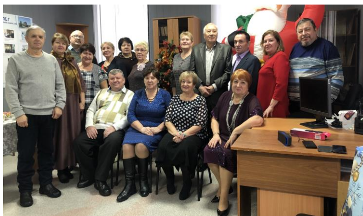
Совет ветеранов поселения Киевский

Администрация поселения Киевский уже много лет тесно сотрудничает и взаимодействует с Советом ветеранов поселения Киевский.