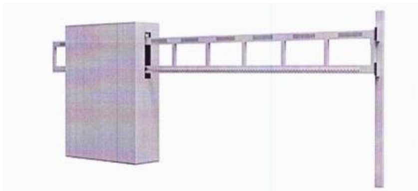
Рис. 3. Внешний вид шлагбаума

Шлагбаум электромеханический антивандальный «Автопроезд», с шириной