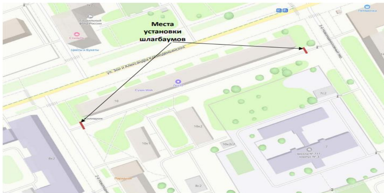
Рис. 1 Схема размещения